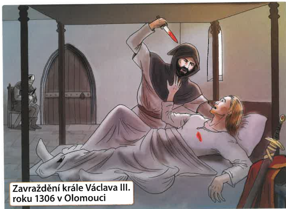
Zavraždění krále Václava III. roku 1306 v Olomouci

Cestou byl neznámým vrahem roku 1306 v Olomouci zavražděn . Václav III. byl posledním mužem z rodu Přemyslovců a neměl žádné děti. Rod Přemyslovců tak vymírá po meči.