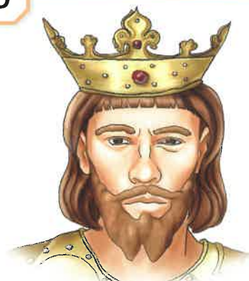
Václav II. (český a polský král)

Václav II. podporoval vzdělání (založil Zbraslavský klášter), rozvoj měst, řemesel a obchodu . Byl schopným politikem a diplomatem . Stal se i králem polským a pro svého syna získal korunu uherskou.