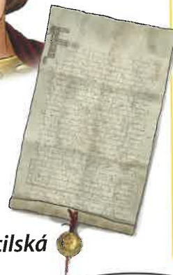
Zlatá bula sicilská

Korunovace králů probíhala jako slavnostní ceremoniál, při kterém byla zvolenému uchazeči na posvátném místě vložena na hlavu koruna a do rukou žezlo, jablko, prsten a meč – korunovační klenoty .