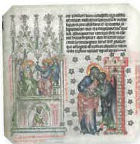
Pasionál abatyše Kunhuty 1314 - 1321

1. Vybarvi správné možnosti, jak docházelo k rozšiřování území Přemyslovců.