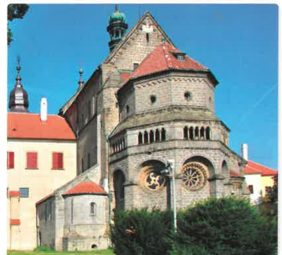
Bazilika sv. Prokopa v Třebíči